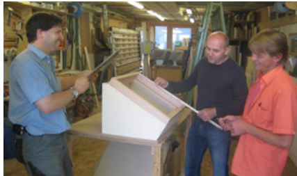
Das Team der sommer holzwerkstatt beim Vermessen eines Prototyps

Die sommer holzwerkstatt produziert den ADES-Solarkocher gemeinsam mit der Institution «Einstieg in die Berufswelt», einem Arbeits- und Bildungsprogramm für stellensuchende Jugendliche im Kanton Zug. Die Endfertigung wird dort durch Jugendliche vorgenommen, die sich auf diese Weise fit machen können für eine Lehrstelle. So profitieren junge Leute in einer schwierigen Lebenssituation direkt von dieser Initiative.