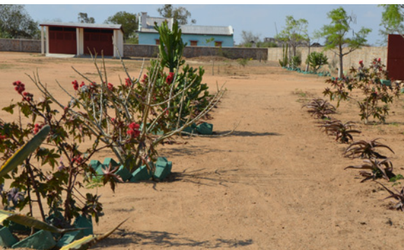
Bepflanzung auf dem ADES-Gelände in Ejeda

Ende 2010 ist die Idee entstanden, in Ejeda ein grünes Zentrum aufzubauen – eine etwas gewagte Idee. Denn der Süden Madagaskars ist hart und unwirtlich, zwar reich an Bodenschätzen und ausgestattet mit einer ganz speziellen Flora, dem Trockenwald des Südens, jedoch mit schwierigen Lebensbedingungen für die Bewohner, die Mahafalys. Lange Trockenperioden, die mehrere Monate oder gar Jahre dauern können, wechseln sich ab mit übermässigen Regenfällen, die ganze Landstriche unter Wasser setzen. Und die Verbindungswege, die durch dieses Gebiet führen, sind Schotterpisten oder Sandwege mit metertiefen Löchern. Vor einem Jahr erst ist es uns gelungen, dank einer grosszügigen Spende einer deutschen Stifterin ein Wasserloch zu bohren, das uns mit genügend Wasser versorgt, um unser Gelände von einem Hektar Grösse regelmässig zu bewässern. Wir mussten zwar 30 Meter tief bohren, bis wir Erfolg hatten. Aber dank dieser Wasserstelle können wir ganz neue Ideen entwickeln und umsetzen.