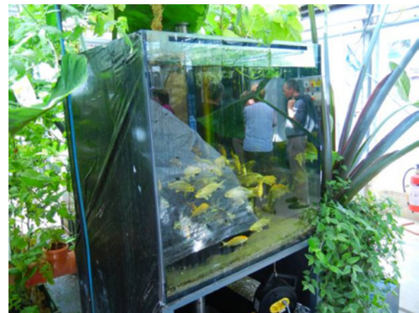
Aquaponic: Ein integriertes Verfahren für die Fischzucht, entwickelt an der ZHAW

(ZHAW) auf dem Programm. Die ZHAW betreibt «grüne» Forschung auf höchstem Niveau, wovon sich die interessierte Zuhörerschaft anschliessend gleich selber überzeugen konnte. Unter anderem präsentiert wurde die innovative HTC-Biokohle, die aus einem hydrothermalen Prozess resultiert, sowie das Aquaponic. Hierbei handelt es sich nicht etwa um eine Reittherapie mit Wasserponys, sondern um integrierte Kreislaufanlagen für Fisch- und Pflanzenproduktion.